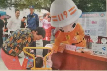
消防宣传队的队员们身穿印有“119”字样的橙色卡通人偶服装，吸引了众多村民围观。

通讯员 李 1月13日，钦州市钦北区钦南镇南岭村“119”消防宣传队，在村中开展消防宣传活动。活动现场，消防宣传队的队员们身穿印有“119”字样的橙色卡通人偶服装，吸引了众多村民围观。 消防宣传队的队员们身穿印有“119”字样的橙色卡通人偶服装，吸引了众多村民围观。消防宣传队的队员们身穿印有“119”字样的橙色卡通人偶服装，吸引了众多村民围观。